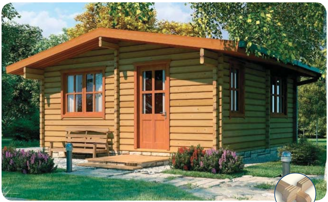
Chatet 6x7 m (5,85x6.85)

Taille de la Sous-sol est indiqué entre parenthèses